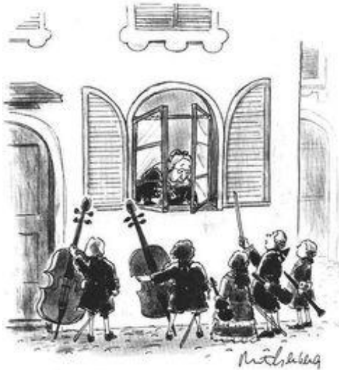
"Can Wolfgang come out and play?"