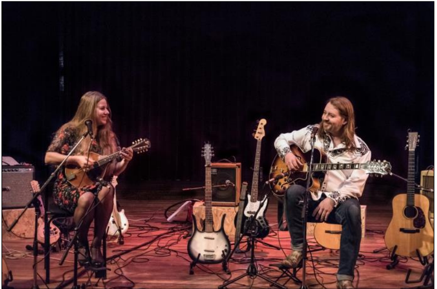
tijdens de CD presentatie in Amsterdam , 8 maart 2020

Klik hier voor de "thuisversie" van El Choclo