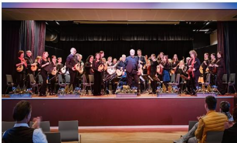
Het grote Festival Orkest