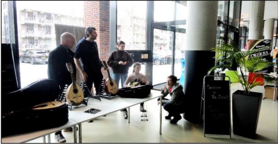
Bij de stands in de centrale hal werd na de aankomst direct al gemusiceerd.

Op 16 en 17 maart 2024 werd in Stein voor de achtste keer het tweedaagse Euregionale Mandolinefestival gehouden, als steeds georganiseerd door de Stichting Mandolin and Guitar Meetings. Ook dit jaar was er in Multifunctioneel Centrum De Grous een bonte groep orkesten aanwezig, waren er stalletjes van instrumentenbouwers en was er een ruim aanbod van bladmuziek en muziekaccessoires. Verder was er in samenwerking met de Culturele Werkgroep Stein in de Grous de tentoonstelling KUNSTMOER georganiseerd met als thema Muziek. Bovendien was er aan het eind van het festival een optreden gepland van het Festival-Orkest, een gelegenheidsformatie onder leiding van Professor Dieter Kreidler. Genoeg te zien en te beleven dus!