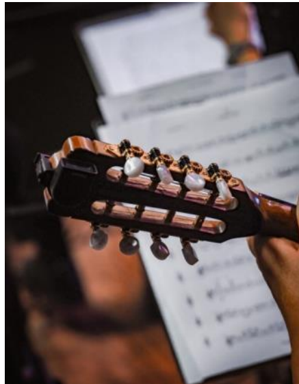
Nog 4 foto's uit de expositie waaronder een motto van Moniek Op Den Camp.