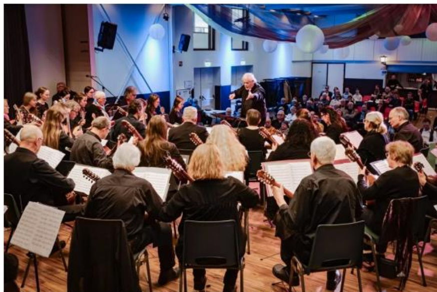
Het grote Festival Orkest o.l.v. Dieter Kreidler