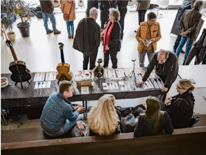
Gezellige drukte bij de stands in de hal.

De foto's bij het artikel zijn door Moniek Op Den Camp gemaakt, behalve die van het kunstwerk van Fons Verhoeven en de foto helemaal aan het begin van het stukje door Marianne Groen.