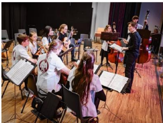
Junior-Zupfer der Mandolinenspielschar Myhl