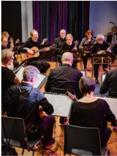
Mandolinen-Orchester Rurtal 1928 Koslar (D)