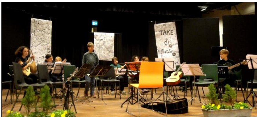
Een ontspannende sfeer op het podium vlak voor het officiële optreden

Na het tekenen volgde een lekkere maaltijd met patat, kipnuggets en een sinaasappeldrankje. Daarna kwamen de deelnemers nog snel een half uurtje bij elkaar om de muziek voor het concert nog één keer goed door te nemen. En toen konden zij met een gerust hart de avond van het Mandoline en Gitaar Festival van de Federatie van Limburgse Mandoline Verenigen openen, waarbij hun werkstukken op het podium werden tentoongesteld.